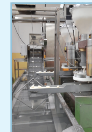
성형 및 냉각